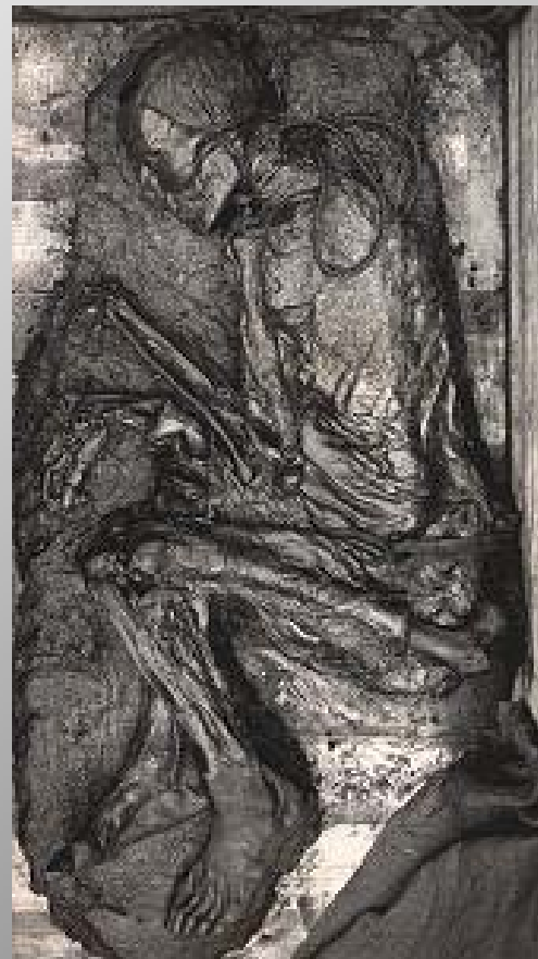
The Tollund Man before preservation