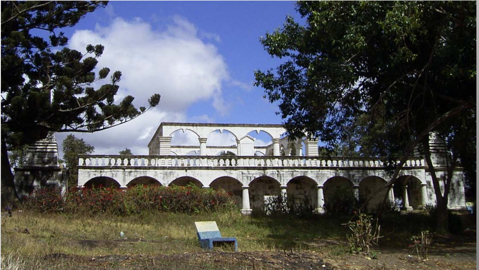
アンタナナリヴ, 「ライニハルの墓」東面