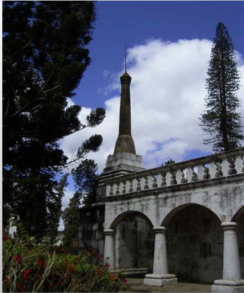
アンタナナリヴ, 「ライニハルの墓」南東角