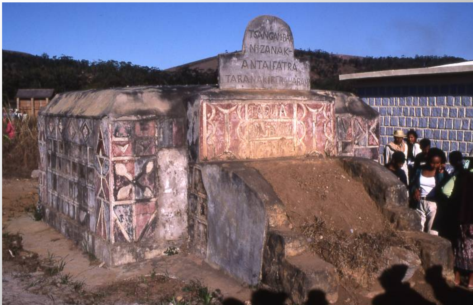
分出元となる石墓