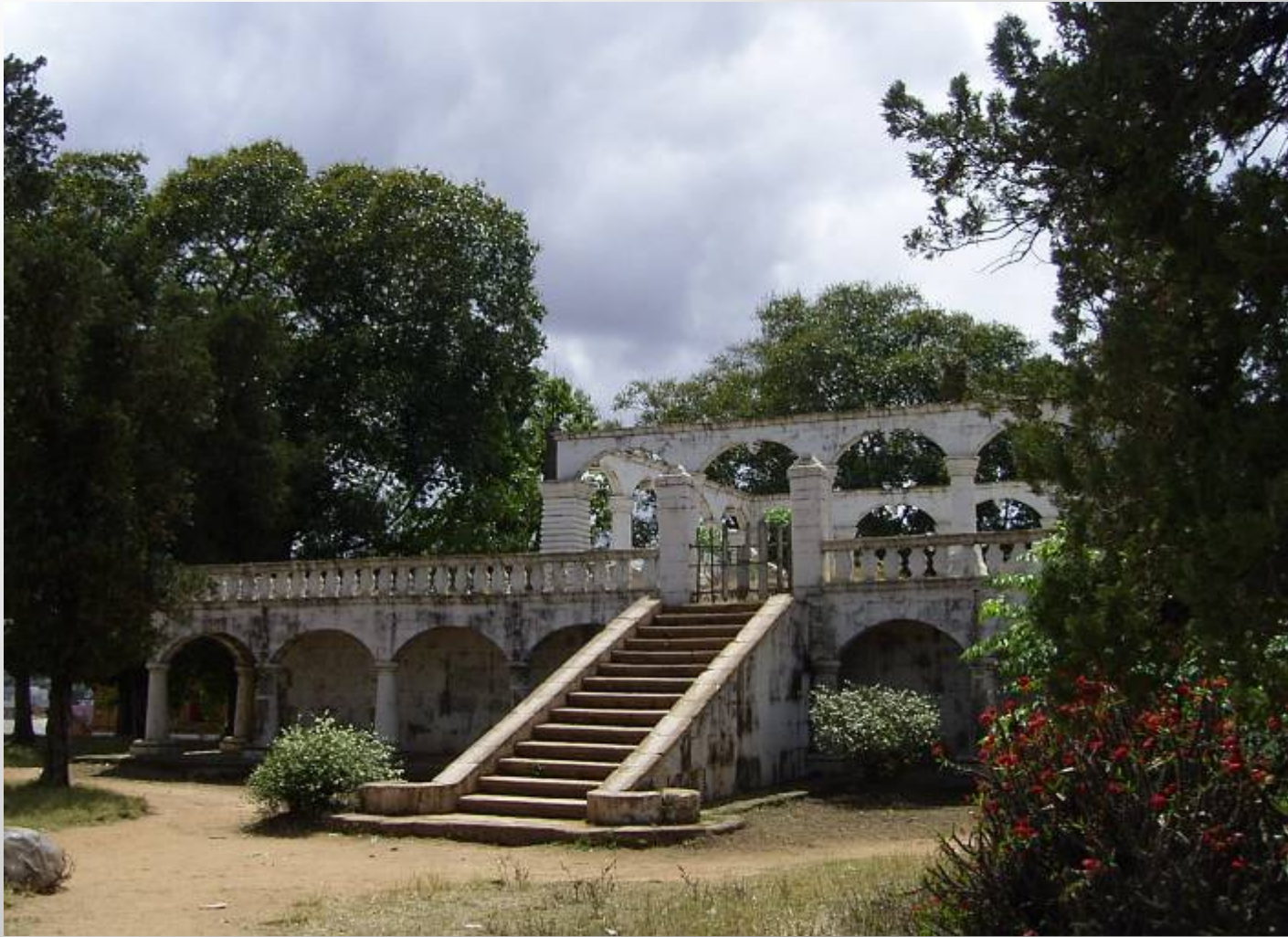
アンタナナリヴ, 「ライニハルの墓」西面