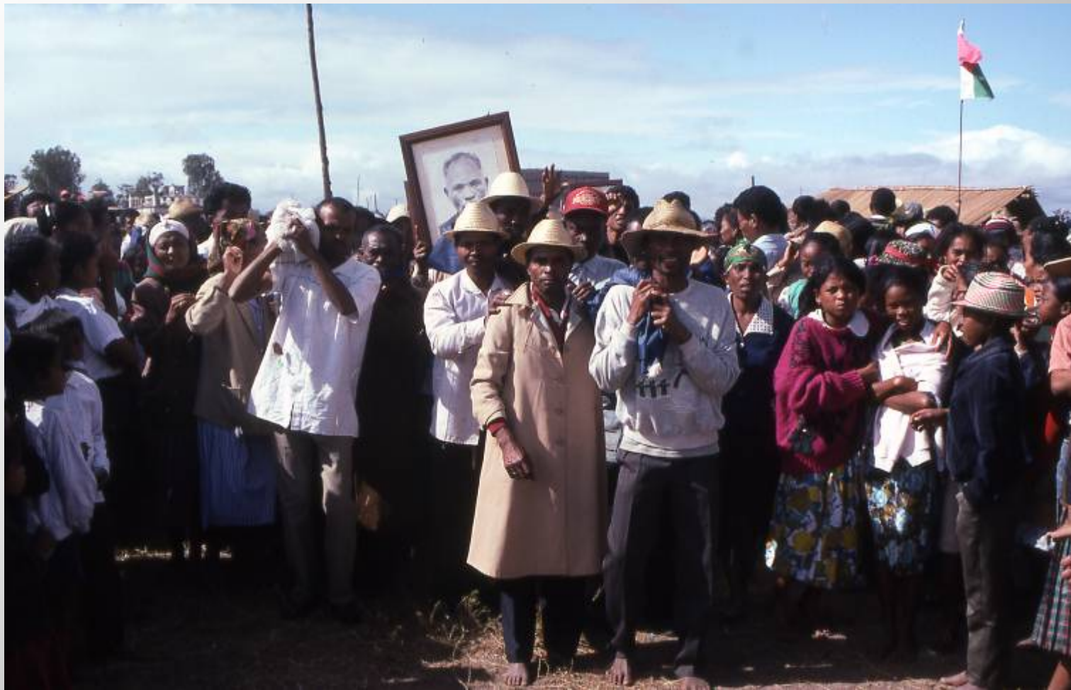
新墓へ遺体の移葬に向かう人々