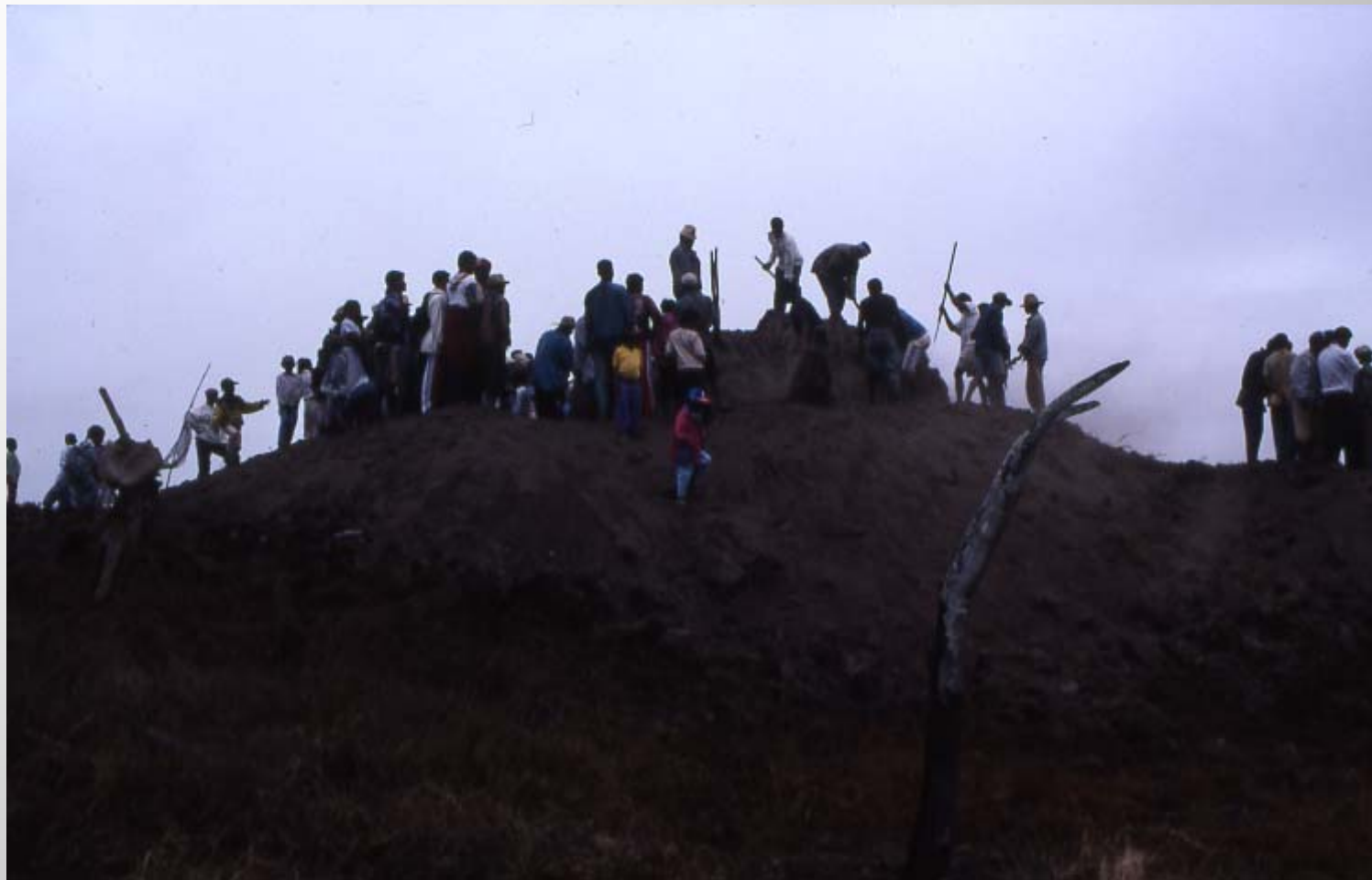
土墓から石墓への移葬