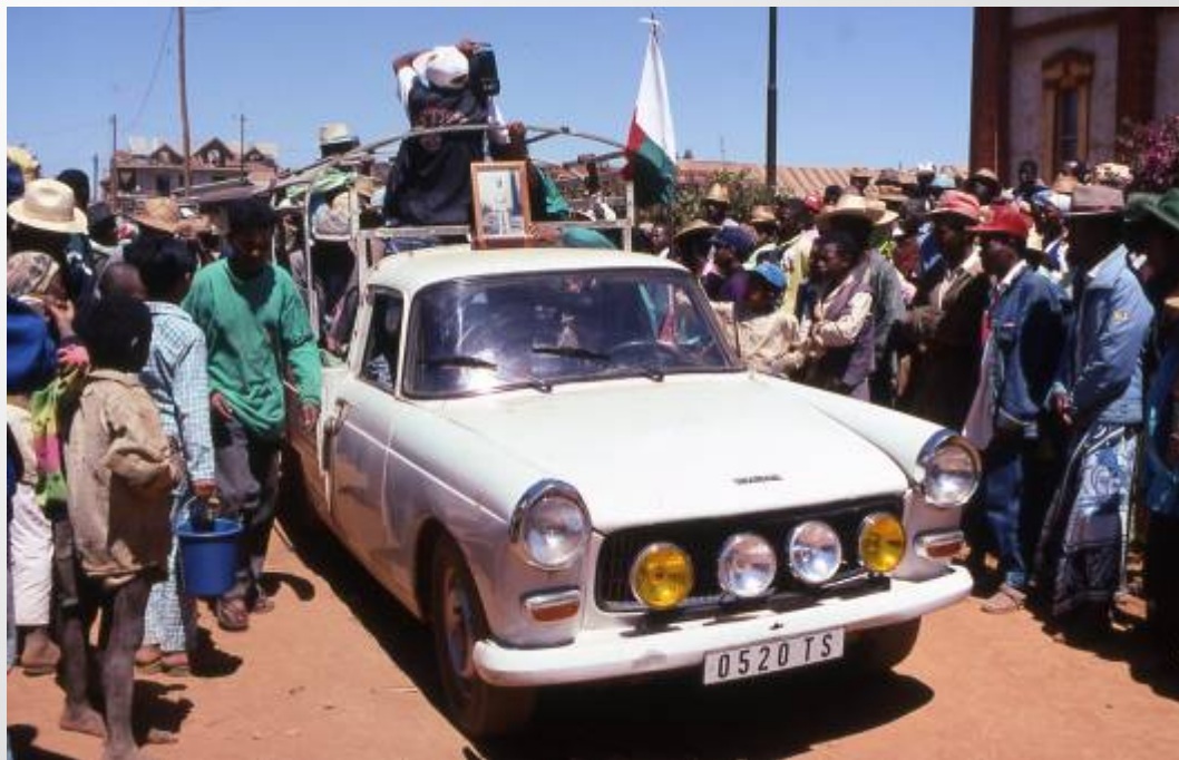
車による遺体の搬送