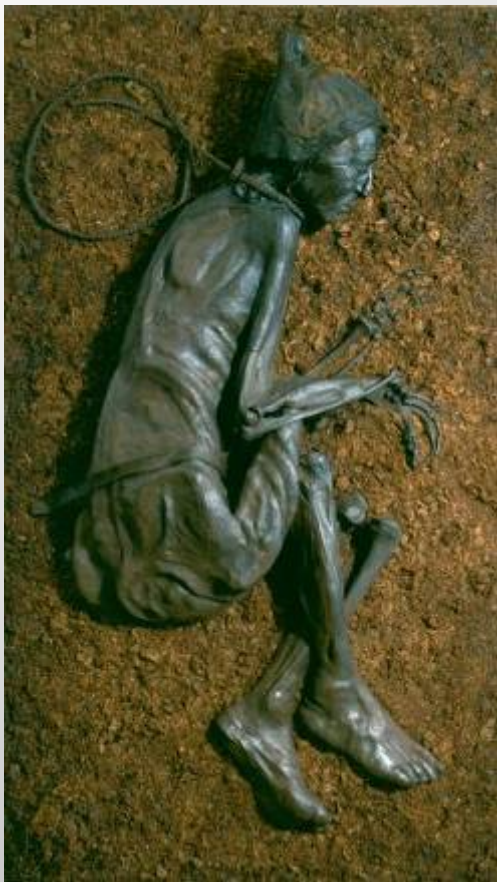
The Tollund Man as he appears today