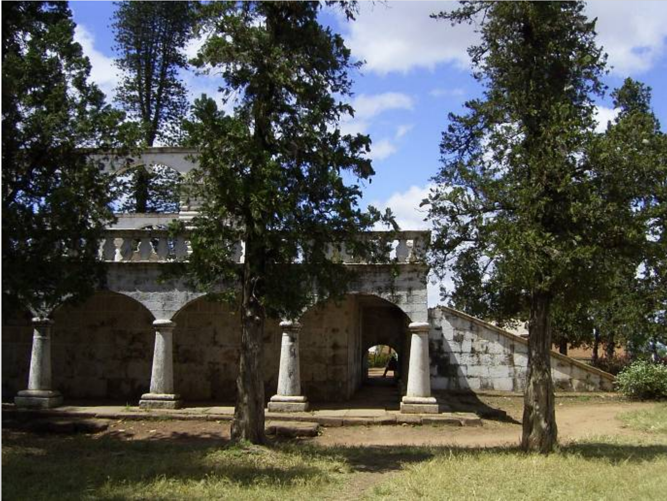
アンタナナリヴ, 「ライニハルの墓」北西角