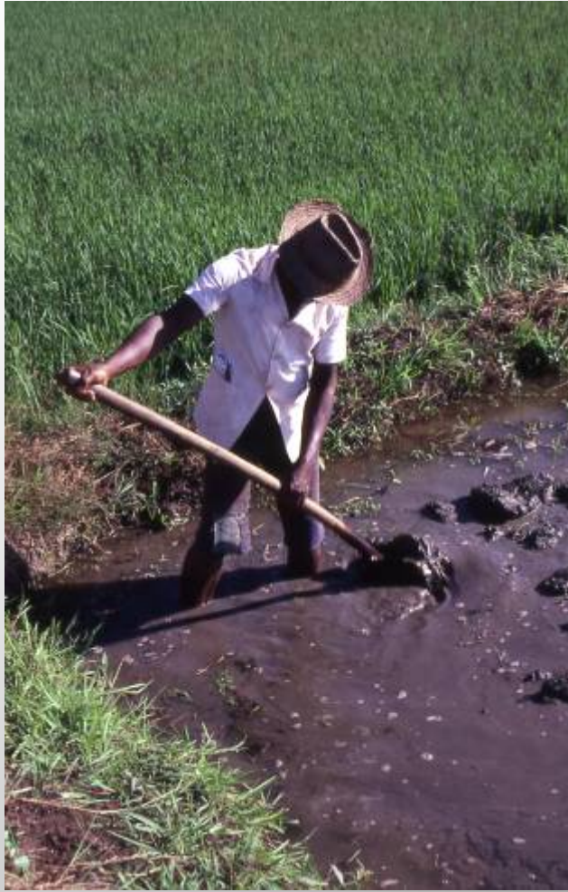
写真左(マルヴァイ近郊): 鋤( angady )