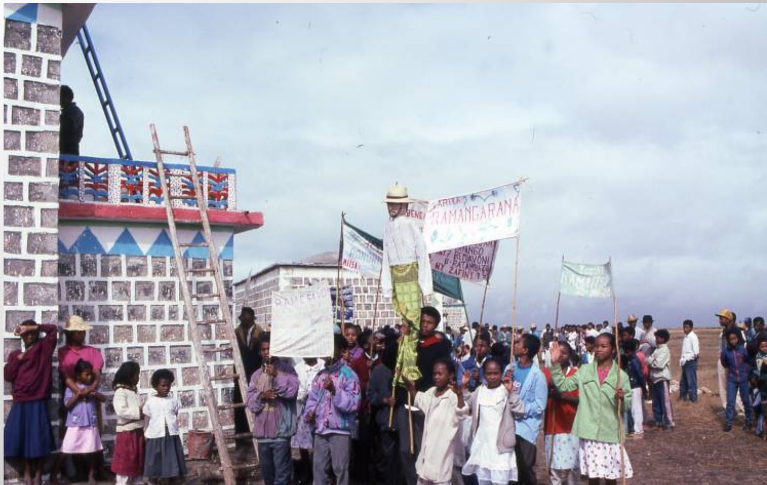
墓の分出にともなうファマディハナ