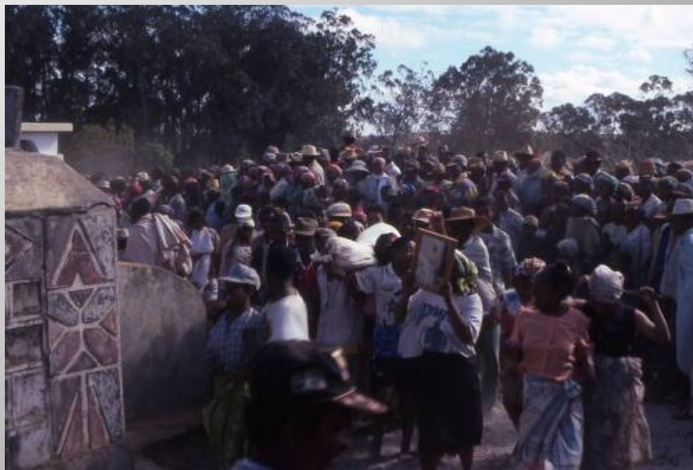
新墓への遺体の移葬