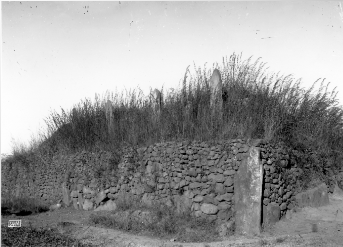
アンタナナリヴ, 1901年