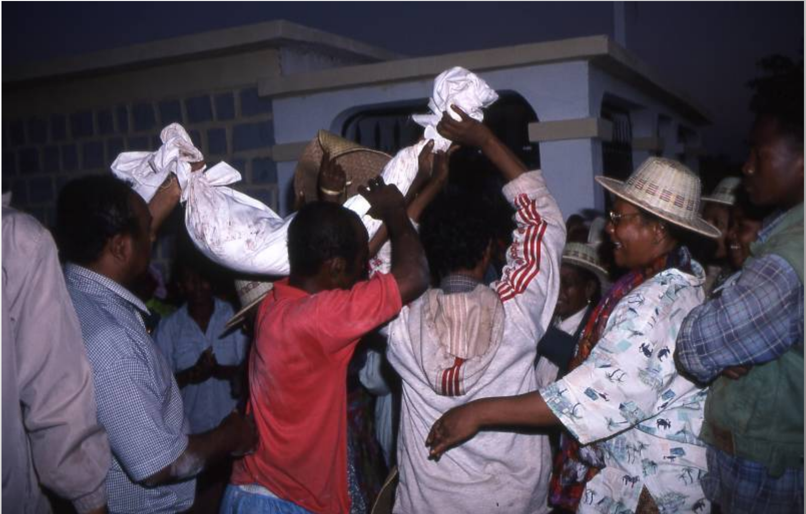
分出元の石墓から取り出された遺体