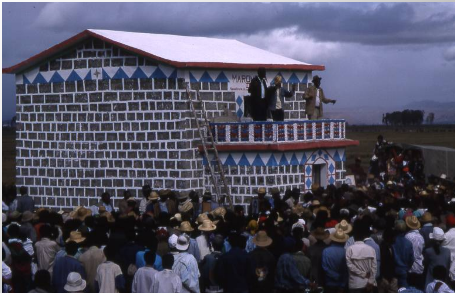
新墓と、その建設当事者たち