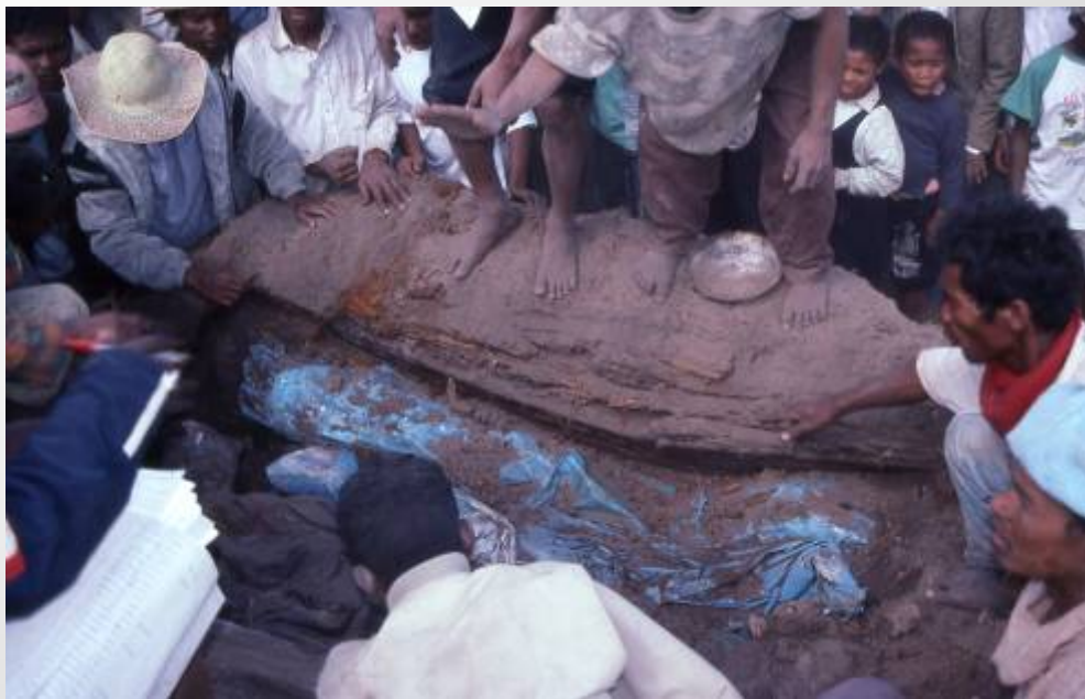
土墓からの遺体の取り出し