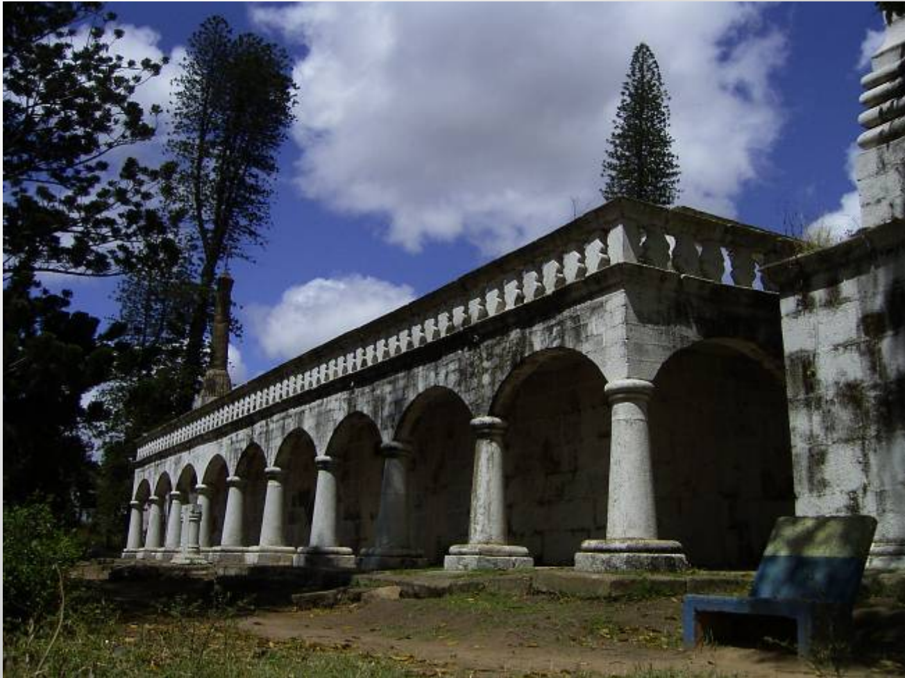
アンタナナリヴ, 「ライニハルの墓」東面